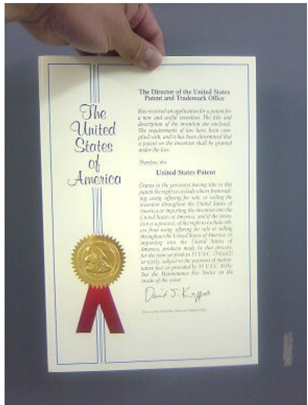
米国特許庁の審査官との激闘の末、取得した特許証

さて、この連載で前回に私は、「文献調査の手を抜く」ことを皆さんに提言しました。その理由は、私たちが「面倒だから」、「楽をしたいから」だと申し上げました。しかし、これはその効果の一面にしかすぎません。「手を抜く」ことの本質的な効果は、定められた時間内に業務を完遂することにあります。我々が英語の文献調査で「楽をしたい」という想いと、会社が「期限までに調査結果が欲しい」という想いは、利害が一致しているのです。つまりこれは、“Win-Win”の関係なのです。